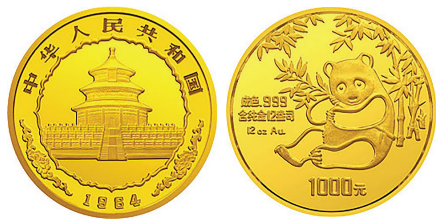
1984版熊猫金银铜纪念币12盎司圆形金质纪念币正面图案(左)和背面图案(右)

独特的币面设计和稀少的发行量使其非常具有研究和收藏价值，可以称之为精制币中名副其实的龙头产品，也标志着中国贵金属纪念币行业在世界上的崛起。